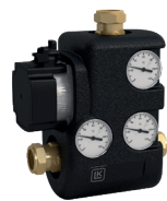
LK 810 2.0